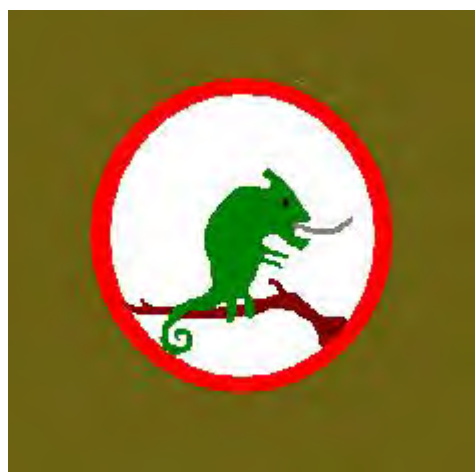
66 Eskadra Towarzysząca