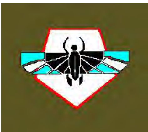
23 Eskadra Obserwacyjna