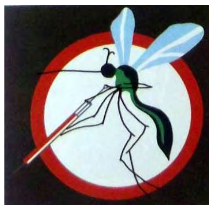
63 Eskadra rozpoznawcza