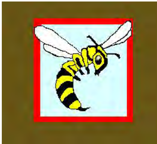
26 Eskadra Towarzysząca