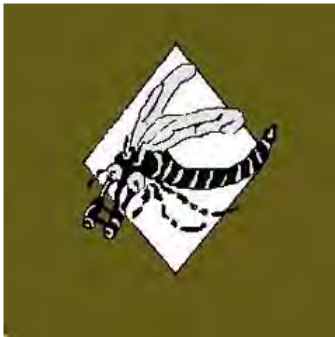
33 Eskadra Towarzysząca