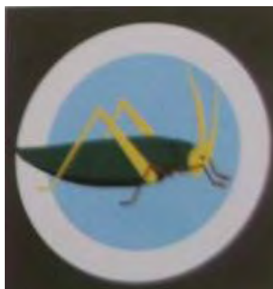
13 Eskadra Towarzysząca