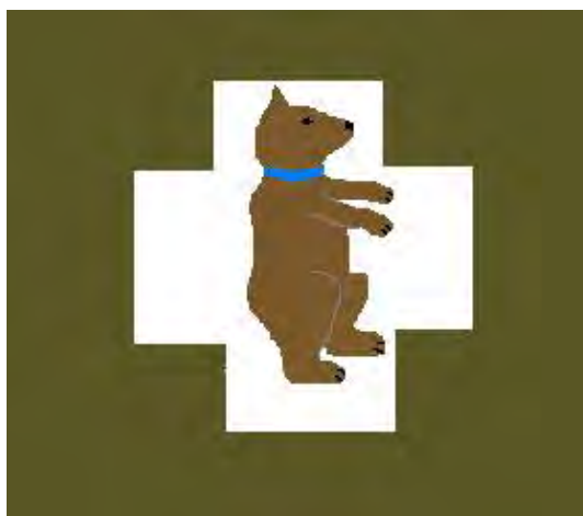
56 Eskadra Towarzysząca